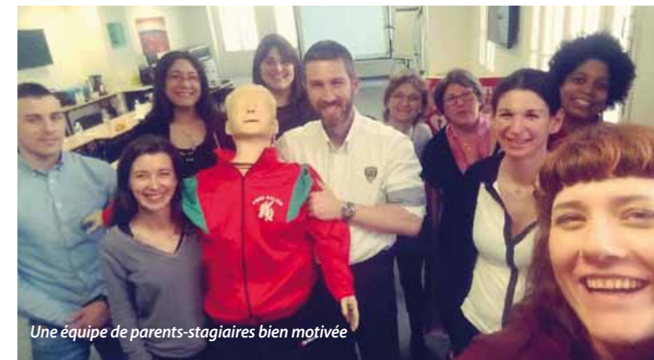
Une équipe de parents-stagiaires bien motivée