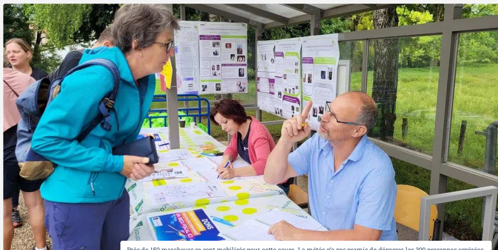
Près de 150 marcheurs se sont mobilisés pour cette cause. La météo n'a pas permis de dépasser les 300 personnes espérées.